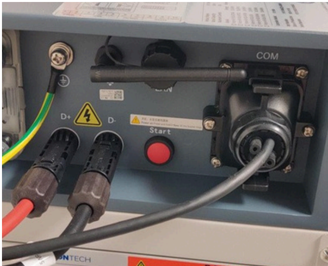
Bild 1. Inkoppling av BMS med en stapel.