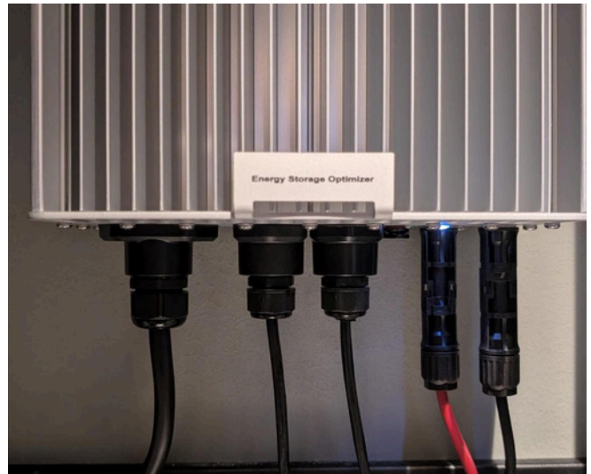
Bild 2. Inkoppling av ESO15.

Försäkra dig om att kabeln mellan BMS och ESO sitter i korrekt port i BMS samt att kontakten i I/O porten på ESO är åt rätt håll.