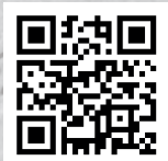
Mer information om KNIPEX StepCut® XL