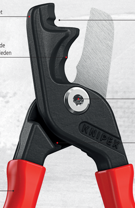
Formen på handtaget gör det smidigt att hålla nära leden med bara en hand