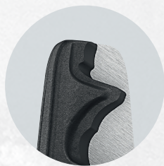
Smalt huvud, bättre åtkomlighet