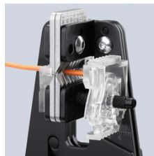
Perfekt inskärning av isolationen längs hela periferin