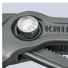
Finjustering med tryckknapp: snabb och komfortabel

Med reservation för tekniska ändringar och fel