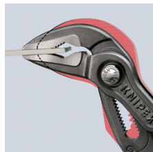
Mycket smal konstruktion i hela huvud- och ledområdet (jämfört med traditionella polygriptånger)