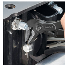
Optimal tillgång till arbetsstycket. Idealisk för service och underhåll, reparation, bilbransch och industri