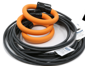
Anpassade Rogowskispolar till EMS96