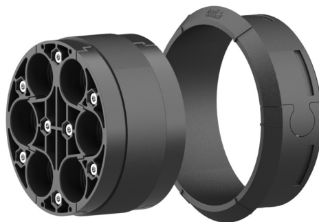
Bilden kan avvika från den valda produkten

För användning med insatsram och plastfläns HSI 150. Delat utförande för tätning av nyinstallationer eller redan dragna kablar.