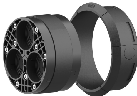
Bilden kan avvika från den valda produkten

För användning med insatsram och plastfläns HSI 150. Delat utförande för tätning av nyinstallationer eller redan dragna kablar.