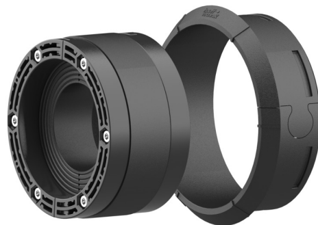
Bilden kan avvika från den valda produkten

För användning med insatsram och plastfläns HSI 150. Delat utförande för tätning av nyinstallationer eller redan dragna kablar.