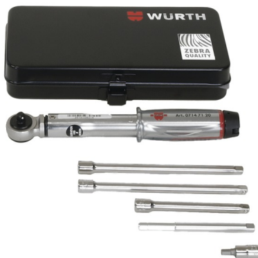
Verkygssats för HSI 150-DG/HRK SSG